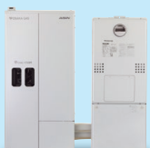
エネファーム type S

エネファームの発電は、天候や時間帯に左右されないため、夜間の照明や冷蔵庫※2の継続運転、お湯の使用が可能です。